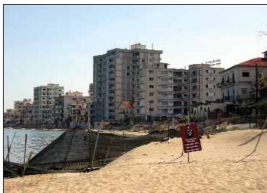
Den forladte by Varosha ved Famagusta

I Famagusta benyttede vi lejligheden til at se ruinbyen Salamis, der i antikken var en af det østlige Middelhavs vigtigste havne, indtil den sandede til, og man flyttede lidt længere mod syd til det nuværende Famagusta. Syd for denne by ligger det store hotel og ferielejlighedsområde Varosha, der ved tidernes ugunst kom til at ligge midt i den grønne zone, og dermed er øde