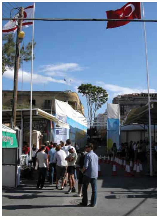
Den nyåbnede overgang ved Ledra Street i Nicosia

Cypern har en rig historie som knudepunkt på handelsruterne i den antikke verden, og dermed også deltager i historiens gang i denne vigtige del af vores civilisation. Men også den nyere