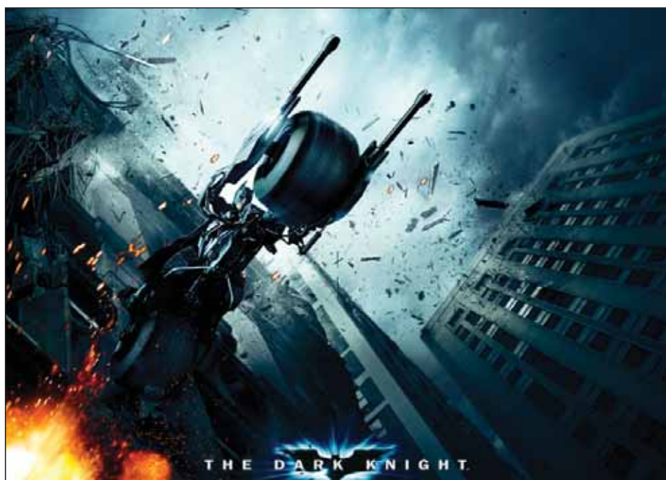
Batman - The Dark Knight, Warner Bros.