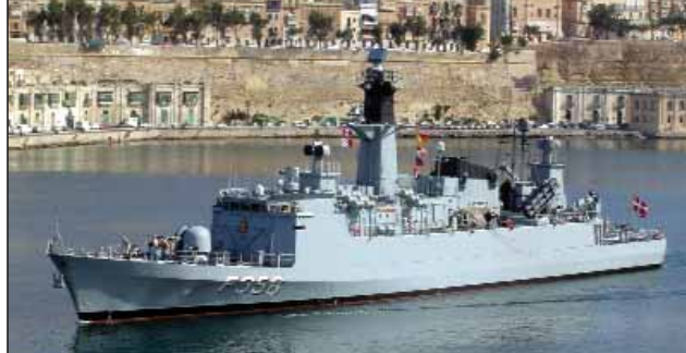
Landlov i sigte! Korvetten Peter Tordenskjold på vej i havn på Cypern

Dog er områder, som nogen måske vil opfatte som velfærd, for eksempel idræt, ikke omfattet, da der tilsvarende findes en idrætsofficer. Under udsendelse til operationer og i andre tilfælde, hvor der er en orlogspræst med, indgår vedkommende som en naturlig del af velfærdsudvalget.