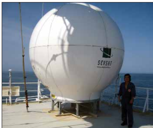
Den indkapslede TV-antenne på Freja Polaris sammen med behørig kort giver adgang til dansk TV så længe skibet sejler indenfor satellittens footprint

en undersøgelse blandt skibe og rederier, der skulle afdække behovet for en videreførelse af ordningen.