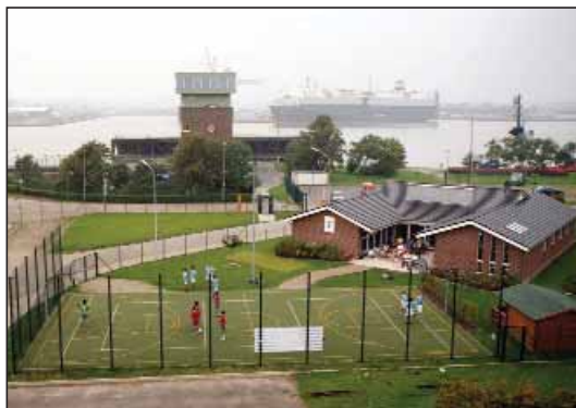
Sømandsklubben i Bremerhaven, som drives af Deutsche Seemannsmission, er en oplagt, men sjældent adspredelse under havneopholdet

De søfarende, som deltog i undersøgelsen, var helt på det rene med, hvad der skal prioriteres under havneophold: Gratis transport, shopping-faciliteter, mulighed for religiøs deltagelse, og skibsbesøg af repræsentanter fra velfærdsorganisationer og sømandsklubber. Samtidig er information om havnene, mulighed for kommunikation med familie og venner og tilgang til e-mail om bord af stor vigtighed.