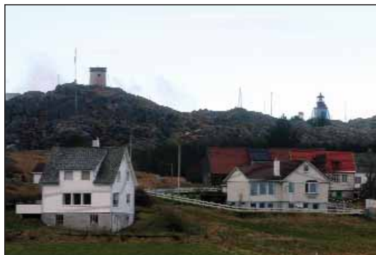
Tvillingefyrene på Utsira

At pendle herud var tidligere ikke muligt, da der ikke fandtes havneanlæg. Da var øen udelukken-